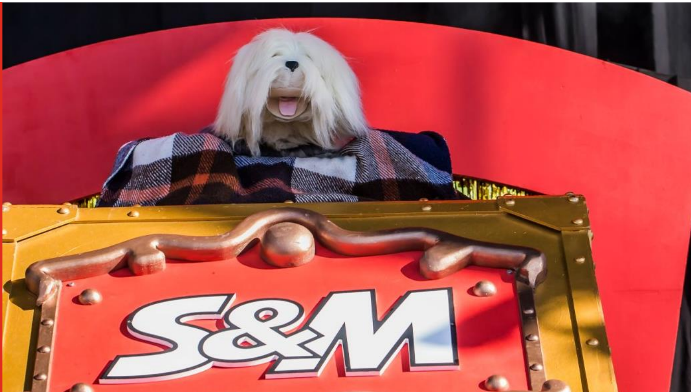
Samson op de Brugse Bavik Dagen (2022).

ik wil leven, ik wil vrij zijn ik wil op m'n eigen benen staan ja, m'n leven moet van mij zijn ik wil kiezen waar ik heen moet gaan en ik spring, spring, spring ik wil leven, ik wil vrij zijn ik wil op m'n eigen benen staan ja, m'n leven moet van mij zijn ik wil kiezen waar ik heen moet gaan en ik spring, spring, spring de wereld in