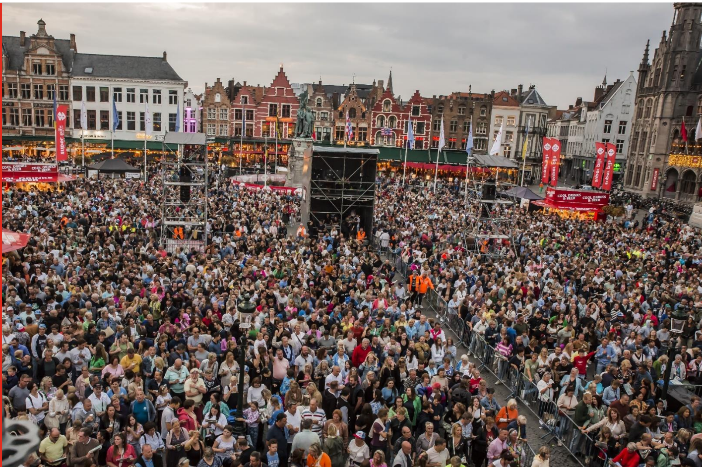
De Markt, het decor van Brugge Zingt.

Good to know: vanaf dit jaar worden alle liedjesteksten geprojecteerd op twee reuzegrote schermen. Wil je de liedjesteksten toch bij de hand hebben? Dan is deze bundel een perfect alternatief.